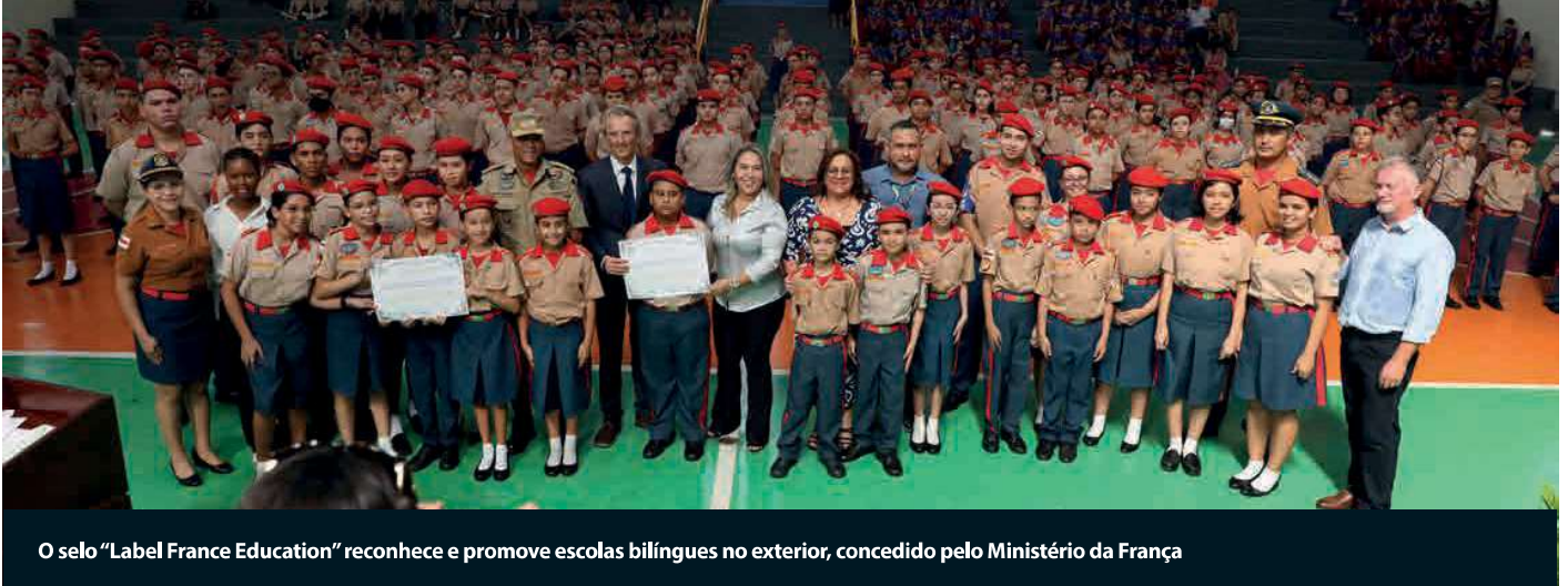
O selo "Label France Education" reconhece e promove escolas bilíngues no exterior, concedido pelo Ministério da França